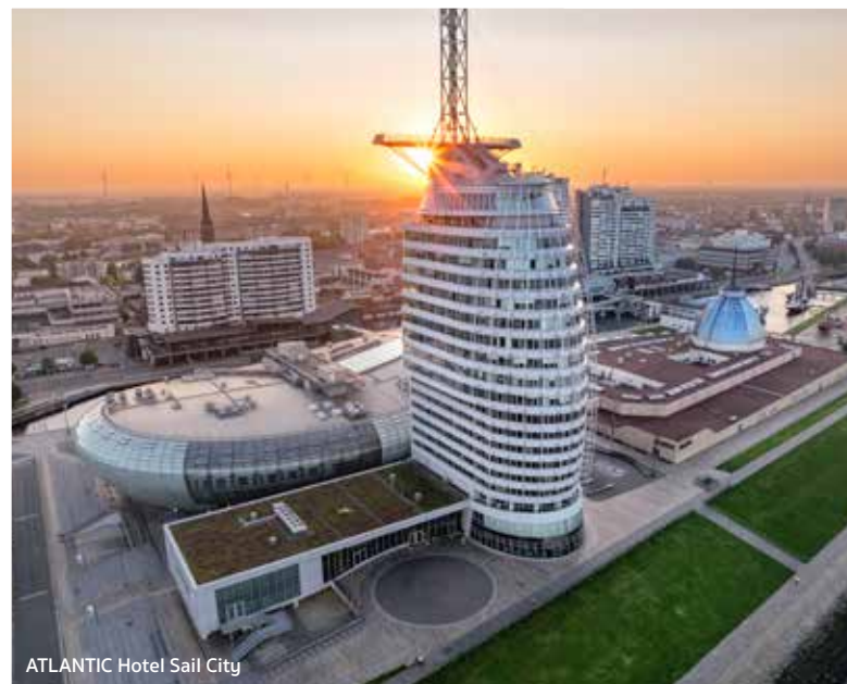
ATLANTIC Hotel Sail City